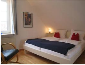
Das großes Doppelbett 180x200cm garantiert erholsamen Schlaf.