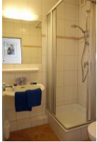
Das Duschbad mit hohem Einstieg.