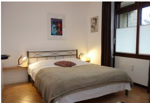
Das Schlafzimmer mit Doppelbett 160x200cm