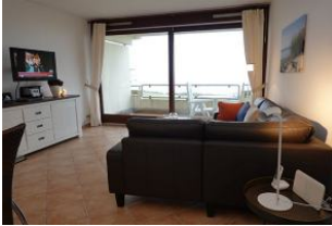
...von der Küche aus gesehen, der Blick Richtung Meer