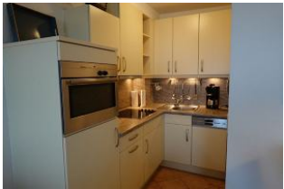
Die moderne Einbauküche.