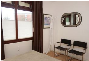
Stühle und Spiegel im Schlafzimmer