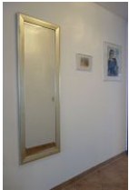
...noch ein letzter Blick in den großen Spiegel...