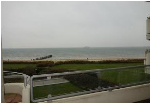
Der winterliche Blick aufs Meer