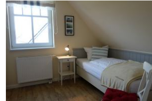
Ein Schlafzimmer im OG mit Einzelbett, auch hier großer Kleiderschrank und TV - Gerät. (nicht im Bild)