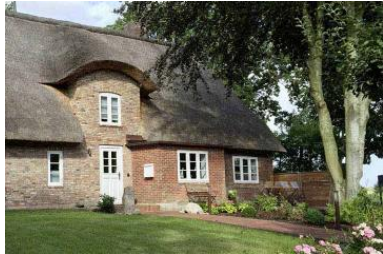
Das Haus WattGut in Oevenum

Die Unterkunft verteilt sich über EG und 1.OG.