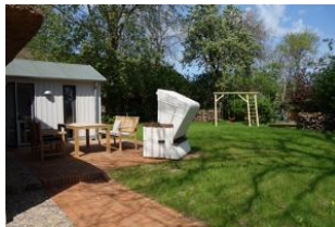
Die Terrasse hinter dem Haus mit dem Garten - nur für Sie zu nutzen. Der Austritt auf die Terrasse befindet sich im Essbereich