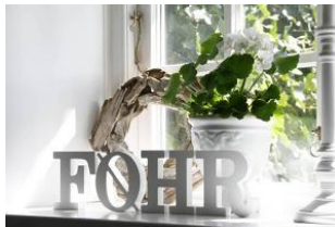
FO E H R