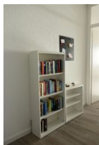
Bücher zum "schmökern" und ein paar Ablagemöglichkeiten im Flur