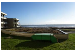
...genießen Sie den Blick in die Weite...