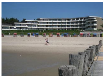
Das Haus Bi de Wyk vom Strand aus gesehen. Die Wohnung C8 befindet sich im Erdgeschoß Mitte