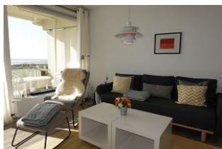
...das sonnendurchflutete Wohnzimmer....