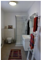
Das frische Bad mit ...