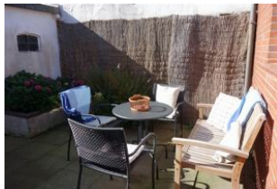
Zur Saison gibt es auch einen gemütlichen Terrassenplatz