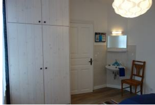
...und Kleiderschrank. Wie in alten Zeiten: ein Waschbecken im Schlafzimmer.