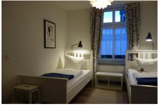
Das zweite Schlafzimmer, neu möbliert mit zwei Einzelbetten a 90x200cm....