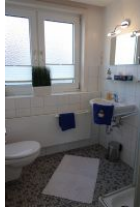
Ein großzügiges Bad mit Handwaschbecken, Toilette...