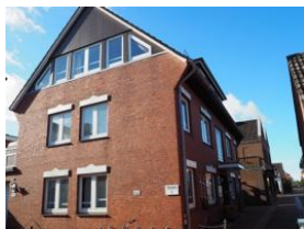
Ansicht Haus Teunis Carl-Häberlin-Str.