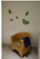
...und gemütlichem Sessel zum ausruhen.