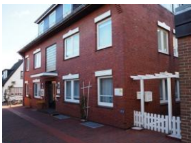
Ansicht Haus Teunis Mühlenstr.