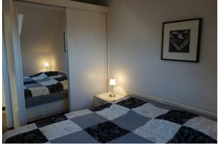
...und genügend Schrankraum für die Reisegarderobe.