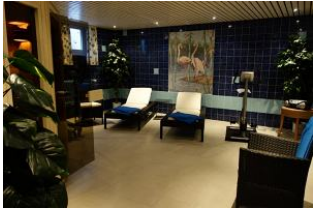
Der Fitnessbereich im Untergeschoß mit ...