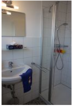
...Spiegel, Ablagefläche und ...