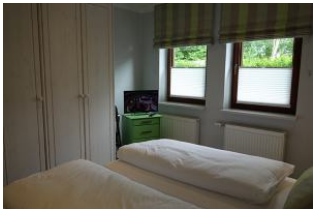
...großem Kleiderschrank und TV-Gerät