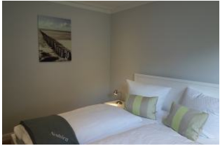
Ein Schlafzimmer mit Doppelbett