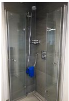
...und Dusche mit Echtglaswand, die komplett weg geklappt werden kann.