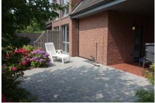
Für das Sonnenbad ein große Terrasse...