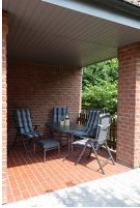
...herrlich, auf der überdachten Terrasse kann man auch Abends lange draußen sitzen...