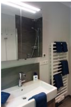
Das Bad mit Handwaschbecken und Toilette (nicht im Bild)....