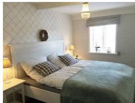
Das Doppelschlafzimmer (Bettmaß 180x200cm) im Erdgeschoß mit ...