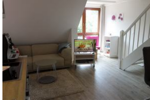
Das Wohnzimmer, die Treppe führt in das Schlafzimmer im Dachgeschoß