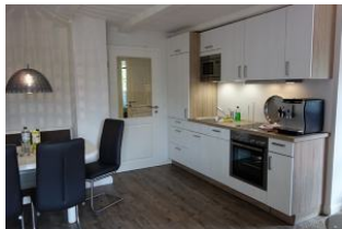
Die offene Küchezeile, links im Bild: der Essplatz