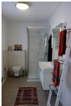
Das frische Bad mit ...