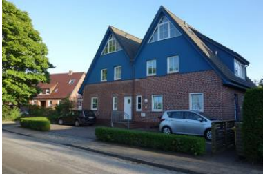
Das Haus Olhörnstieg 6, die Unterkunft befindet sich im Erdgeschoss links