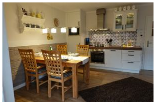
Der Essplatz, im Hintergrund die Küche.