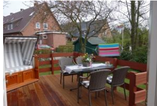
Die herrliche Holzterrasse. Ein Strandkorb darf natürlich nicht fehlen... Im Hintergrund: die Hängematte im Garten