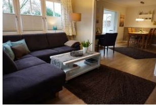
Essplatz, Sekretär und Wohnzimmer