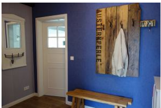
Der Flur mit großer Garderobe...