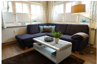
Die gemütliche Couch für einen....

Entfernungen, zirka: zum Bäcker 400 m, zur Einkaufsmöglichkeit 1,0 km, zum Flugplatz 2,7 km, zum Golfplatz 2,6 km, zum Hafen 1,4 km, zum Meer 50 m, zum Badestrand 50 m, zum Ortszentrum 1,0 km