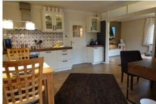
Der Blick zur Küche von der Veranda aus.