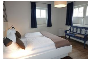
Zwei Fenster lassen auch des nachts genügend Luft herein.....