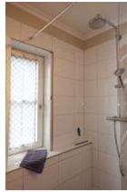
...Handbrause und Rainshower