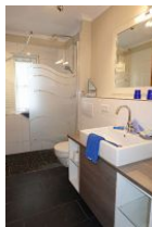
Das Bad mit Handwaschbecken, Toilette und bodengleicher Dusche mit ....

Ein großer Einbauschränk für die Kofferinhalte. TV Gerät.