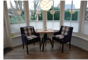
Die Veranda, ein lauschiges Plätzchen für die Teestunde ?