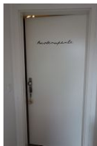
...seien Sie gespannt und treten Sie ein ....