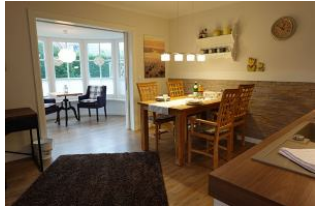
Der Essplatz, im Hintergrund die Veranda