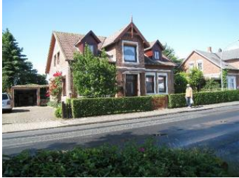
Das Haus Boldixumer Str. 25 in Wyk