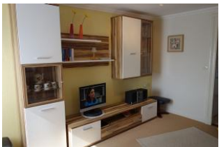
...hier noch einmal von der anderen Seite.