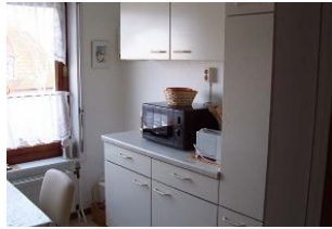
Die andere Seite der Küche