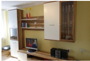
Stereolanlage und Flachbild-TV dürfen nicht fehlen.