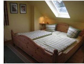
Das große Elternbett im Schlafzimmer