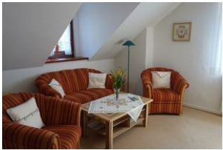
Im Wohnzimmer die gemütliche Couchgarnitur und zwei Sessel

Möchten Sie inmitten der Stadt wohnen ? Alles zu Fuß erreichen können ? Bitte schön. Wir bieten Ihnen diese gemütliche Wohnung für 4 Personen im 1.OG des Hauses Deterding an. Wohnzimmer, Küche mit Eßplatz, 2 Schlafzimmer, neues Duschbad. Keine Teppichböden. In dem hauseigenen Garten wartet ein Terrassenplatz auf Sie. Nach der Fahrradtour, nach dem Strandtag, wann auch immer - Ihr Gartenplatz ist für Sie reserviert.