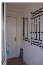
...herein spaziert, es erwartet Sie ...

Nostalgie trifft Moderne - mitten in der Fußgängerzone, mitten in Wyk, kurze Wege zum Strand, zum Bäcker, zum Zeitung holen, zum Einkaufen, zum Essen, zum Schwimmbad - einfach mittendrin ! Die Ferienwohnung Wilma verfügt über 4 Betten, zus. könnte noch ein Kleinkind Platz finden. Die Wohnung wurde gerade teilrenoviert und bietet nun eine moderne Wohnküche und auch ein neues Bad mit flacher Duschwanne. Sehr praktisch, insbesondere für unsere älteren Gäste. Stellen Sie Ihr Auto einfach auf dem Parkplatz ab und genießen Sie die zentrale Lage in der Wyker Innenstadt