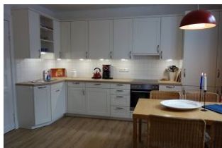
.... großer Küchenzeile...