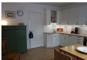
...eine moderne Wohnküche, mit Highboard....