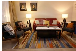
...nehmen Sie Platz... auf der modernen Ledercouch oder gemütlichem Sessel.....