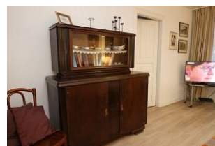
.....Nostalgie pur ...