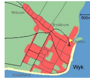
Entfernungen, zirka: zum Bäcker 60 m, zur Einkaufsmöglichkeit 200 m, zum Flugplatz 4,0 km, zum Golfplatz 4,1 km, zum Hafen 500 m, zum Meer 120 m, zum ÖPNV 300 m, zum Badestrand 120 m, zum Ortszentrum 30 m