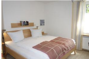
Das Schlafzimmer mit Doppelbett...(180x200cm)....