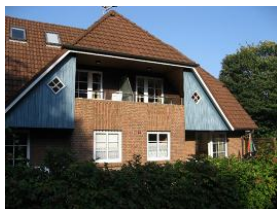
Die Rückansicht des Hauses, rechts unten die Terrasse der Wohnung 1