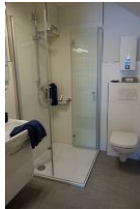
Das Bad im Ganzen...