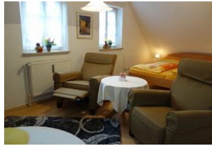
...beim Zurücklehnen kommt das Fusssteil hoch - Entspannung pur.....