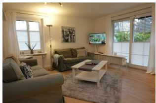
TV Gerät und Austritt auf die Terrasse