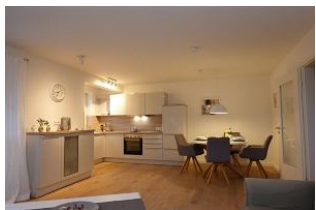
Der Blick zum Essplatz und zur offenen Küche.