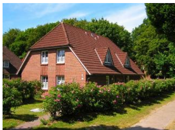
Das Haus Godewind im Eulenkamp/Ecke Gmelinstrasse, die Whg. 1 befindet sich links im Haus im EG