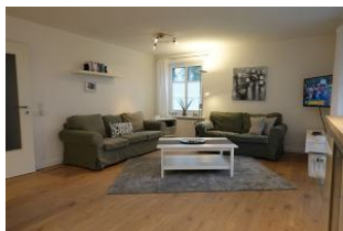
Zwei gemütliche Couchen für den TV Abend, oder zum lesen, oder einfach nur zum "langmachen"