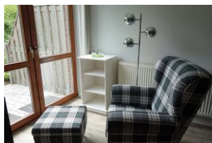
...mit Blick aus dem Fenster oder für eine Lesestunde ?