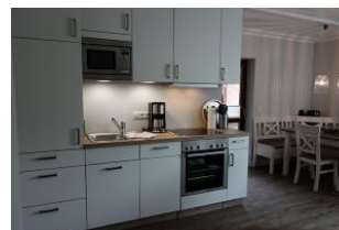
Die offene Küchenzeile, im Hintergrund der Essplatz