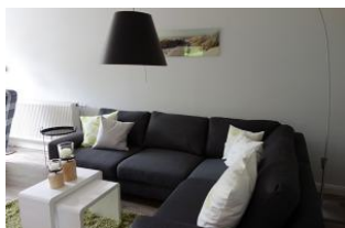
Die große Couchecke lädt zu langen Klönabenden ein.