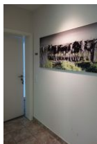
..treten Sie ein, die Wohnung "Atlantis" erwartet Sie..