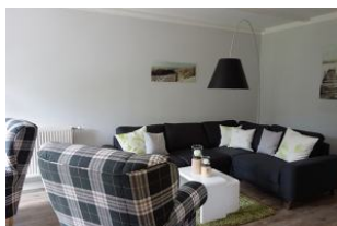
...oder darf es ein gemütlicher Sessel sein ?