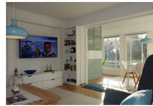
Der Blick von der Couch zum TV