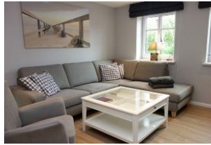
Die große Couch hat für alle ein Plätzchen

Der gemütliche Sitzbereich mit Blick zum Esstisch und zur Küche. Platz.