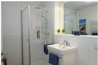
Das Duschbad, Handwaschbecken, nicht im Bild, die Toilette