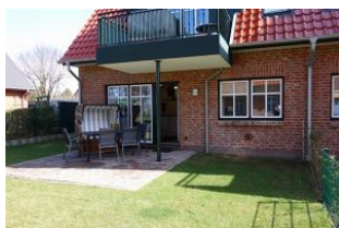
Die Terrasse mit kleinem Gartenteil, der komplett eingezäunt ist.