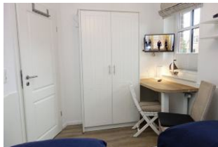
Schrank und TV Gerät