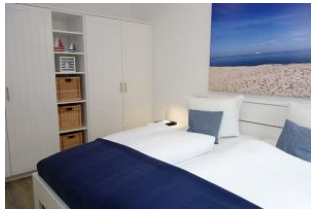
...genügend Schrankraum, nicht im Bild, das TV Gerät