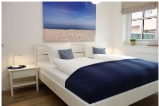
Großes Doppelbett im Elternschlafzimmer 180x200cm