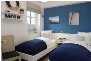
Das Kinderschlafzimmer mit 2 Einzelbetten