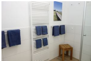
Für jedes Handtuch ein Plätzchen