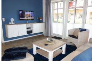
TV Gerät, rechts die große Glasfront zum Garten