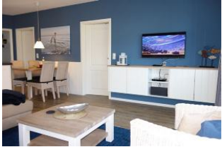
TV Gerät und Blick zum Esstisch