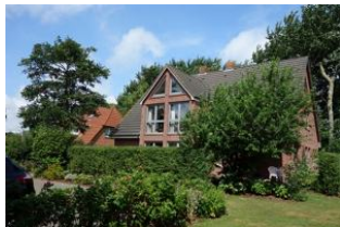
Haus Neshörn in Wyk im Sommer Die Unterkunft befindet sich im 1.OG

Das Haus Neshörn ist zu erreichen über die Straße "Am Leuchtturm" Hausno. 4 liegt gemeinschaftlich mit der "Strandvilla" auf einem großen Grundstück der Familien Buchner/Petersen. Die Whg. 3 (Rüm Hart) befindet sich im 1. und 2. OG des Hauses und hat ausreichend Platz für 4 Personen. Großer Wohn/Essraum mit offener Küche im 1.OG sowie ein Doppelschlafzimmer und das Duschbad. Im 2.OG befindet sich das zweite Schlafzimmer mit großem Doppelbett und einem weiteren Bad mit WC und Handwaschbecken. Der Clou: ein herrlichen Balkon, der Ihnen die Nachmittags- und Abendsonne beschert.