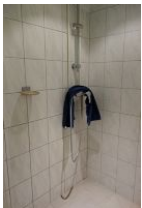
... Dusche und ...