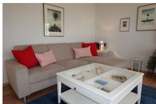
....machen Sie es sich gemütlich .....