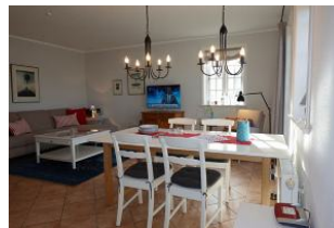
Der Esstisch. Im Hintergrund das TV Gerät und die Couch.