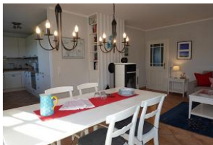
der lange Esstisch, im Hintergrund der Ofen.