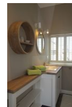
...und das dritte Bad...