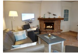
Couch und zwei Sessel. Kamin und TV Gerät. Es wird Ihnen an nichts fehlen für einen gemütlichen Abend