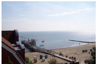
Der traumhafte Blick auf die Mittelbrücke

"über den Dächern von Wyk..." so fühlt man sich in diesem fast 100 Jahre alten Stadthaus. Genießen Sie bei einer guten Tasse Tee diese traumhafte Aussicht auf das Meer, die Mittelbrücke und nicht zuletzt das bunte Treiben auf der Promenade, dem Sandwall. Die modern eingerichtete Wohnung mit dem Charme alter Gemäuer versetzt einen zurück in die "gute, alte Zeit". Teppichböden gibt es keine mehr. Mittendrin wohnen, den Blick genießen, die Kurmusik aus der Ferne hören - Erholung pur.... Unser Tipp: vergessen Sie das Fernglas nicht! Aber Vorsicht: in diesem Haus sind die Treppen lang, steil und die einz. Stufen kurz. Allein zur 1.Etage sind es schon 17 Stufen.