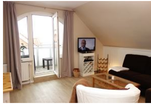
...und Austritt auf den Balkon....