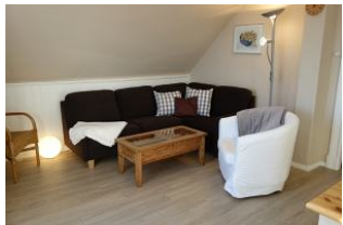
Couch "ums Eck" mit Fussteil und zus. Sessel