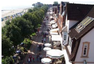
....und auf den Sandwall