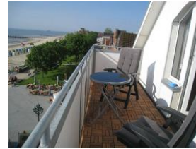
... über den Dächern von Wyk....