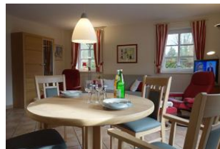
...nehmen Sie Platz ! Guten Appetit.