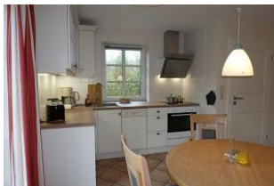
...hier noch einmal