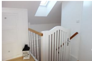
Ein Sicherheitsgitter oben an der Treppe.