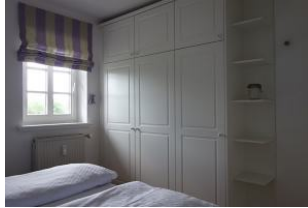
... und Einbauschränk, der alle Kofferinhalte aufnehmen kann.