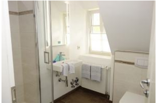
Das Bad mit Waschtisch, Dusche und Toilette