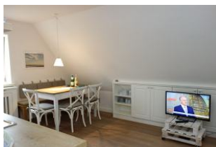
Das TV Gerät darf natürlich nicht fehlen