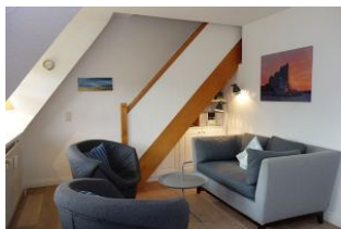
Gemütliche Sitzecke mit kleiner Couch und zwei Sesseln

Komfortable, in warmen Farben eingerichtete OG-Wohnung für 2-4 Personen. Auf halbem Weg zwischen Wyk und Nieblum steht dieses Reetdachhaus mit 4 Wohneinheiten. Wer die Ruhe sucht, den weiten Blick über Pferdekoppeln liebt, wohnt hier genau richtig. Das Meer ist so nah, man kann es fast riechen. Ideal auch für Golfer, denn der Golfplatz ist zu Fuß erreichbar.