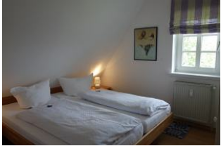
Das Schlafzimmer mit einem Doppelbett 180x200cm