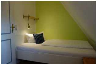
Das Kinderzimmer ist klein und gemütlich, verfügt über ein großes Bett 120x200cm