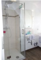
Die neue Duschkabine, flacher Einstieg