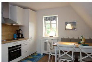
Der Esstisch mit Bank und drei Stühlen