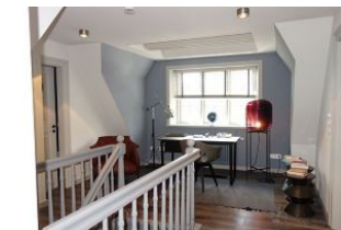
Der Flur im OG mit Schreibtisch für kreative Gedanken.