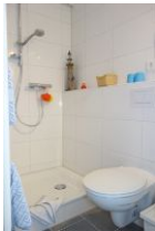
Die Dusche und Toilette, nicht im Bild das Handwaschbecken.