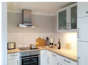
...und die Elektrogeräte dürfen natürlich auch nicht fehlen.