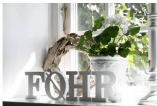
FO E H R