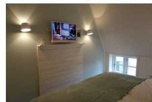
... ebenfalls mit Flachbild - TV - Gerät