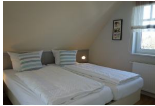
Zwei Einzelbetten - zusammen gestellt - im Elternschlafzimmer im OG...