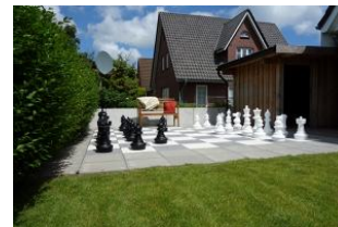
Das versprochene Schachbrett im Garten zum Spielen für die ganze Familie