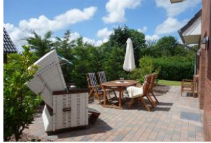
Die herrlich eingewachsene Terrasse. Die Terrassentür befindet sich am Essplatz.