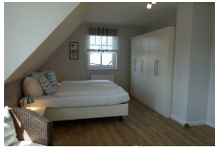
Viel Schrankraum .....