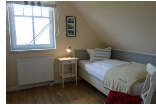
Ein Schlafzimmer im OG mit Einzelbett, auch hier großer Kleiderschrank und TV - Gerät. (nicht im Bild)