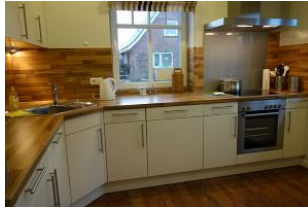
Die sep. Küche hat alles "was man so braucht"