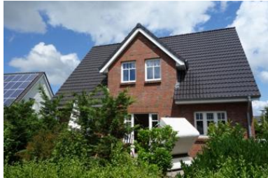
Das Haus Flurstrasse 28

Die Unterkunft verteilt sich über EG und 1.OG.