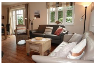
Zwei Sofas garantieren einen gemütlichen Abend

Dieses Einzelhaus in der Flurstrasse in Wyk, läßt Urlaubsherzen höher schlagen. Herrlich für Familien. Vier Schlafzimmer geben jedem Familienmitglied eine Rückzugsmöglichkeit. Der gemeinsame Wohn- Essraum mit halb offener Küche dient der Kommunikation. Zwei Bäder lassen auch am Morgen nicht das Frühstück in unendliche Ferne rücken. Das Fensteröffnen zum lüften ist nicht nötig, das Haus verfügt über eine zentrale Lüftungsanlage, die einen hohen Komfort der Raumluft garantiert. Hier wurde an Alles gedacht, seien Sie gespannt. Ach übrigens, sind Sie vielleicht Schachspieler ? Im Garten befindet sich ein 4x4 m großes Schachfeld aus Steinplatten, den Schlüssel zum Schrank für die großen Figuren bekommen Sie bei uns !