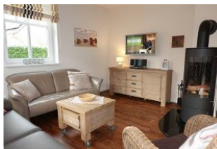
Das TV Gerät und Ofen