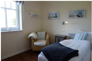
Ein Schlafzimmer im Erdgeschoß mit Einzelbett, Kleiderschrank. Nicht im Bild, das TV - Gerät.