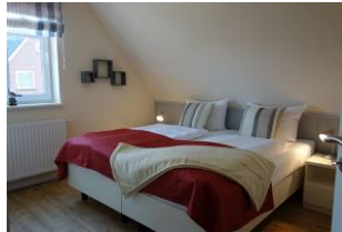
Ein weiteres Schlafzimmer im OG mit zwei Einzelbetten und Kleiderschrank.