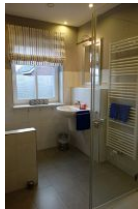
Das Duschbad im EG, hier befindet sich auch die Waschmaschine, die Ihnen kostenfrei zur Verfügung steht.