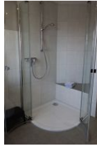
....großer Duschkabine und einer Sitzbank für Kinder