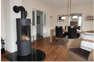
Der Ofen, im Hintergrund der große Esstisch und Durchgang zur Küche