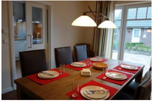
Der große Esstisch - im Hintergrund, die Küche. Rechts die Terrassentür