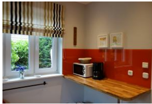
...und eine sep. Arbeitsfläche