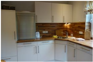
Ein Teil der Küchenzeile...