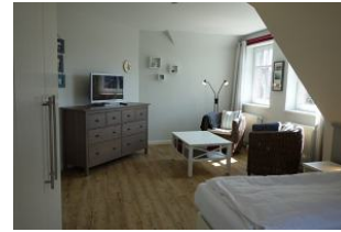
... herrlich groß, mit gemütlichen Sesseln für die Lesestunde, oder einen Film anzusehen.