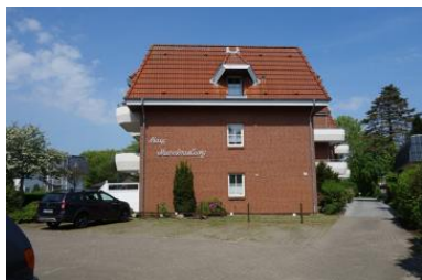
Die Aussenansicht des Hauses Meeresbrandung Gmelinstr. 12 in Wyk