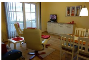
Zwei Relaxsessel zum Fernsehen, entspannen, lesen ....