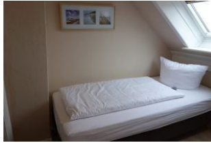
Das Schlafzimmer mit zwei Einzelbetten (Box-Spring-Betten)