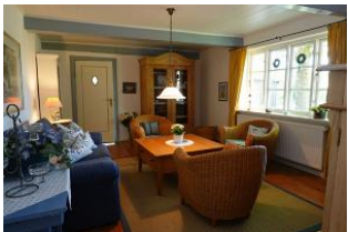
Das gemütliche Wohnzimmer