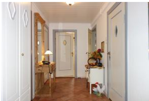
...treten Sie ein...