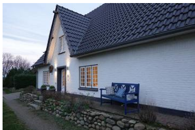
Die Aussenansicht des Hauses Friesengeist in Wrixum, Ohl Dörp 25

Die Unterkunft verteilt sich über EG und 1.OG.