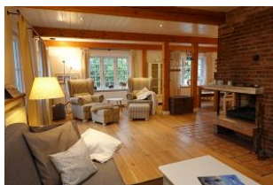
...gemütliche Couch, 2 Sessel und der Kamin - was braucht man mehr ?