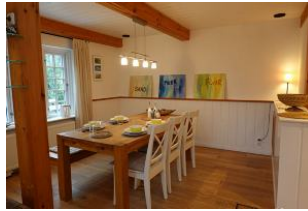
Ein Esstisch für Alle.