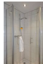
Das Badezimmer im Obergeschoß mit Dusche....