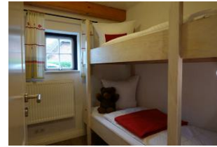
..klein aber fein, das Kinderzimmer mit Etagenbett. Nicht im Bild, ein kleines TV Gerät