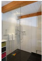
...hier noch einmal aus der Nähe