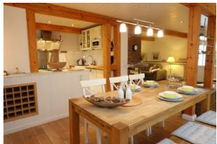
Der Tisch ist schon gedeckt, wer kocht ???