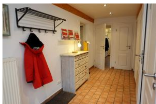
...treten Sie ein, schauen sich um ...

Das Haus Friesengeist in Wrixum für max. 7 Personen hat seine Besonderheiten. Ursprünglich als 2-Familien-Haus gedacht, vermieten wir nur noch an eine Gästepartie, niemand stört den Anderen. So verfügt das Friesengeist über zwei voll eingerichtete Wohneinheiten, dadurch gibt es für jedes Familienmitglied eine Rückzugsmöglichkeit. Ideal für mehrere Generationen, die gemeinsam Urlaub machen, aber auch gern einmal eine Tür hinter sich schließen möchten. Ein gemütliches, altes Friesenhaus in der Stille Wrixums - herrlich !