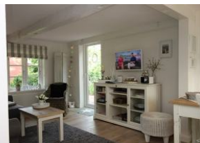
Blick ins Wohn-/Esszimmer