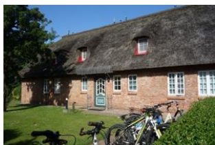
Der Eingang zu den Wohnungen 1, 2, 4 und 5

Das Hus Dikstian in Alkersum mit insgesamt 5 Wohneinheiten bietet auch befreundeten Familien die Möglichkeit "unter einem Dach" zu wohnen. Die Wohnung 1 befindet sich im hinteren Teil des Hauses, welches zum Garten gelegen ist. Sie verfügt über 3 Schlafzimmer mit 6 Betten normaler Größe. Das große Wohn/Esszimmer bietet jedem Familienmitglied ein Plätzchen. Die sep. Küche, voll eingerichtet, gibt auch dem Hobbykoch eine Chance. Das reetgedeckte Haus steht auf einem großen Grundstück, welches für alle Gäste zu nutzen ist. Zu jeder Wohnung gehört eine eigene Terrasse. Parkplatz auf dem Grundstück.