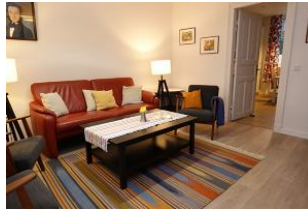
Das farbenfrohe Wohnzimmer bringt gute Laune...