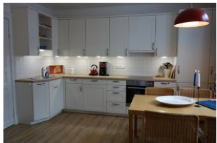
.... großer Küchenzeile...