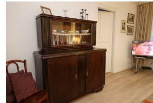
.....Nostalgie pur ...