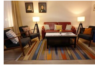
...nehmen Sie Platz... auf der modernen Ledercouch oder gemütlichem Sessel.....