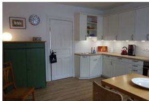
...eine moderne Wohnküche, mit Highboard....