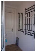
...herein spaziert, es erwartet Sie ...

Nostalgie trifft Moderne - mitten in der Fußgängerzone, mitten in Wyk, kurze Wege zum Strand, zum Bäcker, zum Zeitung holen, zum Einkaufen, zum Essen, zum Schwimmbad - einfach mittendrin ! Die Ferienwohnung Wilma verfügt über 4 Betten, zus. könnte noch ein Kleinkind Platz finden. Die Wohnung wurde gerade teilrenoviert und bietet nun eine moderne Wohnküche und auch ein neues Bad mit flacher Duschwanne. Sehr praktisch, insbesondere für unsere älteren Gäste. Stellen Sie Ihr Auto einfach auf dem Parkplatz ab und genießen Sie die zentrale Lage in der Wyker Innenstadt