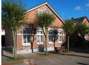
Die Unterkunft befindet sich im EG.

Die Aussenansicht des Hauses in der Wilhelmstr. 4 Der Eingang befindet sich an der Rückseite Zum Be- und Entladen dürfen Sie bis ans Haus fahren