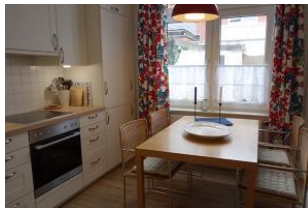
... und einem Essplatz am Fenster.