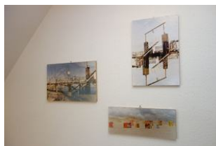
Bilder im Flur im OG