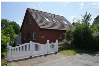
Das Haus Dithmarschen im Susanne-Fischer-Weg 1b