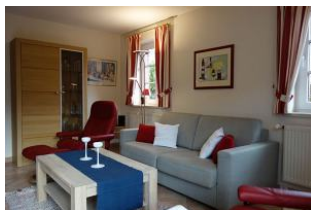
Couch und toller Stressless Sessel mit Fusshocker