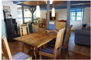
Der Essplatz, kurze Wege zur Küche