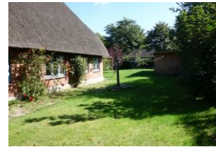
Ein Teil des Gartens