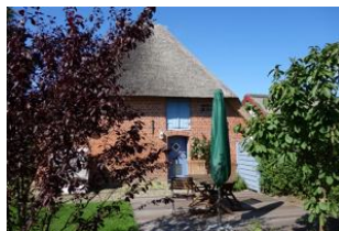
Der Blick von der Einfahrt zum Haus