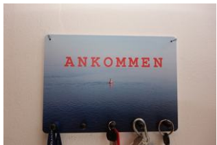
A N K O M M E N - Willkommen !