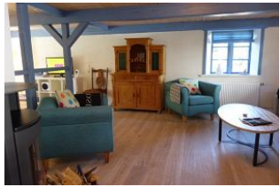
Zwei gemütliche Sessel für den Abend am Ofen ?