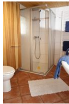
...und großer Duschkabine.