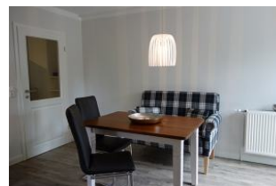
...oder auch mit bequemen, freischwingenden Stühlen.