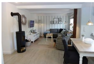
...der Blick in die gemütliche Sitzecke