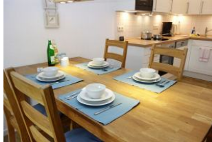
....nehmen Sie Platz, sieht aus, als gäbe es bald etwas zu essen.