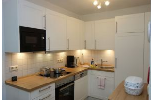
...mit viel Platz für Küchenutensilien