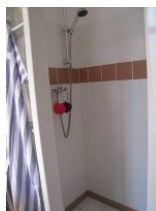
...die gemauerte Dusche, die zwei Handbrausen bereit hält...