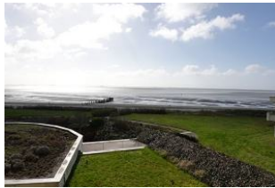
...dieser Aussicht gibt es nichts mehr hinzuzufügen....