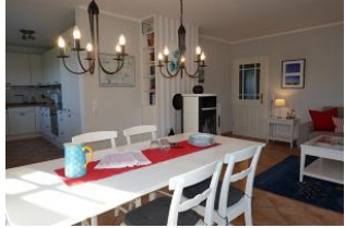
der lange Esstisch, im Hintergrund der Ofen.