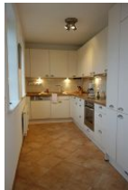
Die sep. Küche vom Wohnzimmer aus zu begehen.